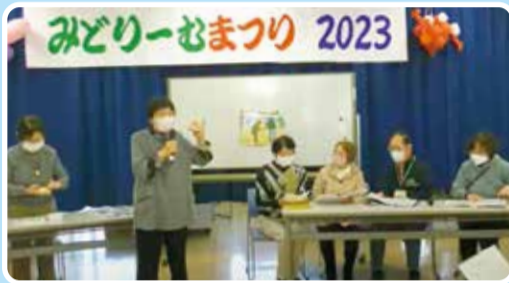
仲間と読み聞かせを披露