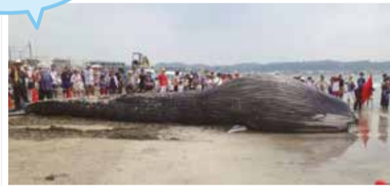
▲鎌倉市由比ガ浜に漂着したクジラ