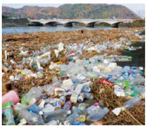
▲散乱する海岸のプラスチックごみ